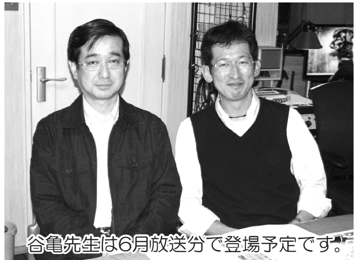
谷亀先生は6月放送分で登場予定です。

ていないということです。以前「医療は生活に出会えるか」という本を読んだことがありますが、まさにそういうジレンマだと思います。ガイドラインやマニュアルは必要不可欠なのですが、一人ひとりの生き方に沿ったサポートをする「人に優しい医療」も目指してほしいものです。在宅医療は新しい医療のための突破口かもしれませんね。これからの医療に期待しましょう。